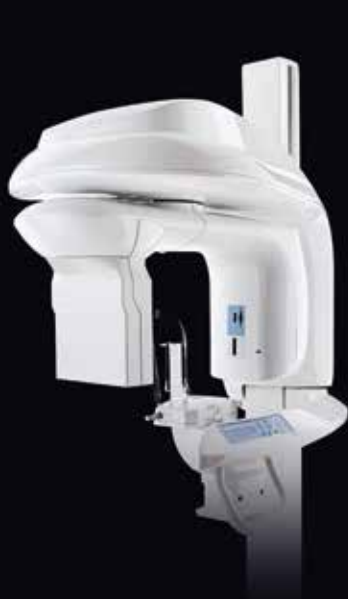
CS 9000 CS 9300