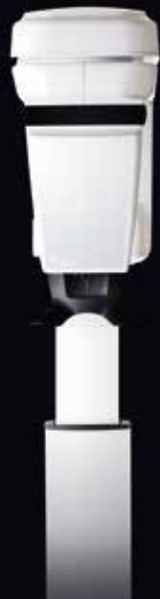
CS 8100 3D