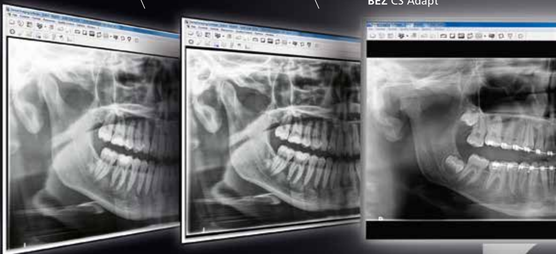
BEZ CS Adapt

Aktualizacja twojego oprogramowania Carestream Dental o CS Adapt oferuje: